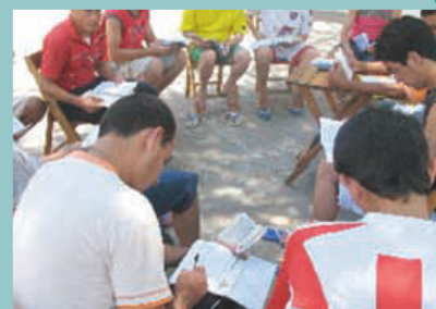
Un tiempo de alabanza mientras hacemos manualidades